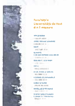
Insert pagină policromie