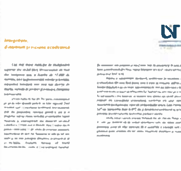
Pagină de interior