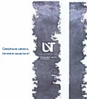
Insert pagină policromie